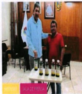
Chevo, apoya para limpieza de panteón de Amuco