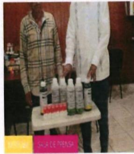
Chevo, entrega más apoyos en gestoría de comisarios